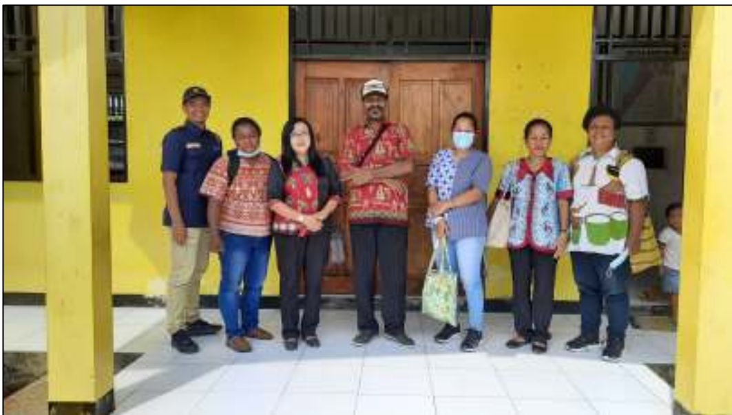
Kegiatan Sosialisasi Penggunaan Orbit Pro Sebagai Sarana/Alat Layanan Jaringan Internet